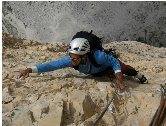
| Perlen vor die Säue.

In älteren Touren und bei vielen unserer Vorgänger wurden diese A0-Stellen gerne mal unterschlagen. Es wurde also nur der überwiegend leichte Teil einer Seillänge bewertet. Die Boulderstelle an den zwei eng beieinandersteckenden Haken jedoch unterschlagen. Bei langen Routen gibt es diese Stellen zwangsläufig immer wieder. Homogene Touren in den oberen Schwierigkeitsgraden sind eine Seltenheit. Ad hoc fallen mir hier nur sehr wenige ein. Die „Perlen vor die Säue“ an der Kleinen Zinne oder die „Alix“ im Verdon wären zum Beispiel Kandidaten.